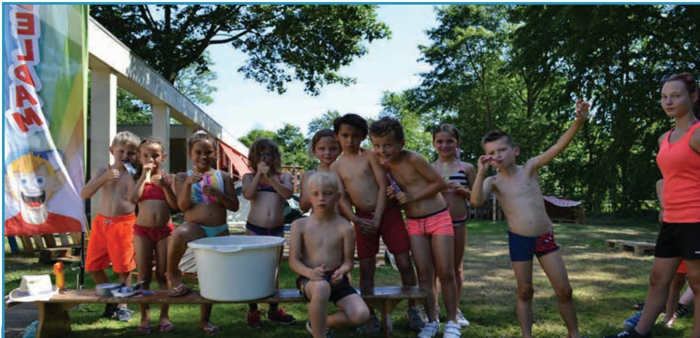
Huttenbouwen blijft een heel secuur werkje!

NUMMER 7 | DINSDAG 23 JULI 2019 | 54 STE JAARGANG