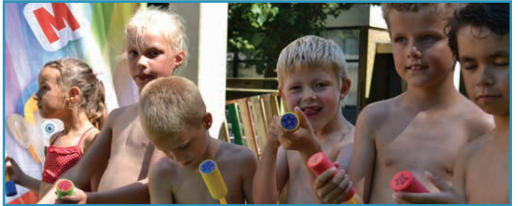
Een zootje ongeregeld op het podium tijdens werktijden... Tsssss....

In noodgevallen zijn wij woensdagavond en nacht bereikbaar op nummer: 06-19281022