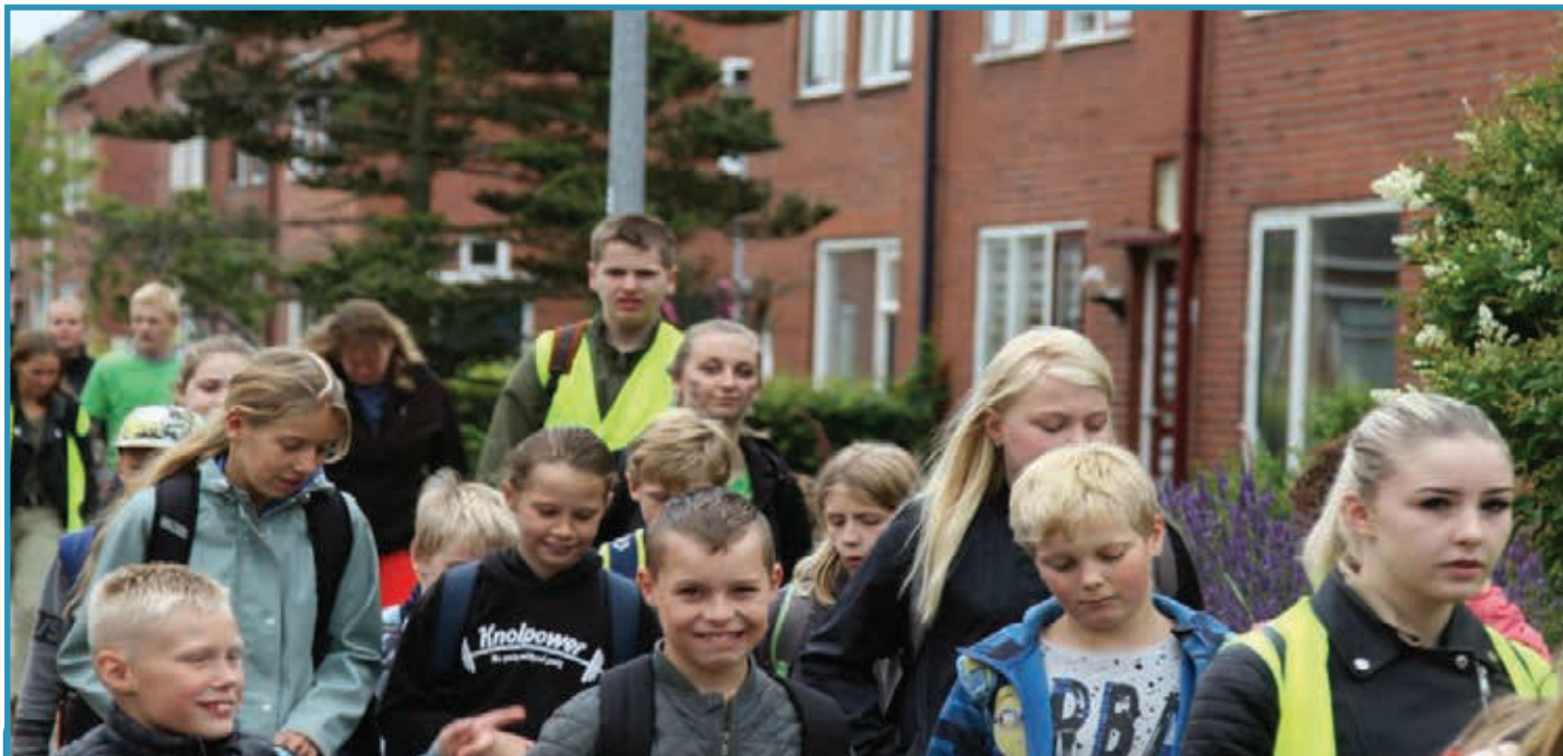
En we zijn weer onderweg voor de tweede Kriebeldam-dag!

NUMMER 3 | DINSDAG 16 JULI 2019 | 54 STE JAARGANG