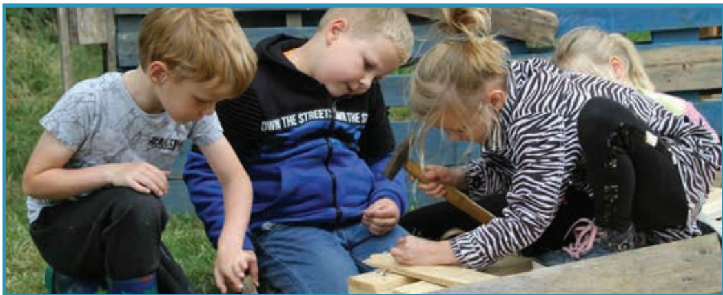
Huttenbouwen blijft één van de top-activiteiten.

De eerste serie foto's van de maandag staan sinds vandaag op de website.