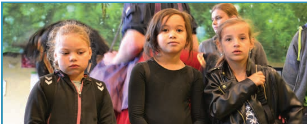
Deze drie jongedames waren er ook al vroeg bij vanmorgen.

De groepen 4 t/m 10 gaan woensdag op de fiets weg. Controleer nu alvast of je fiets wel veilig is!