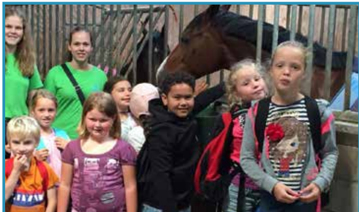
Bij de kippenboer stonden ook een paar paarden.