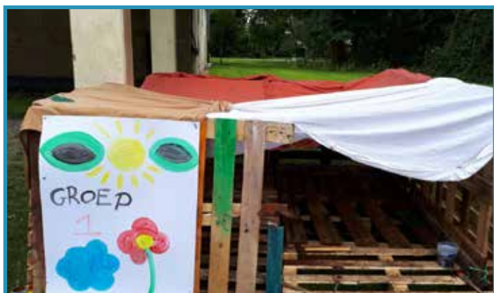
En nog een hut, deze keer die van groep 1.