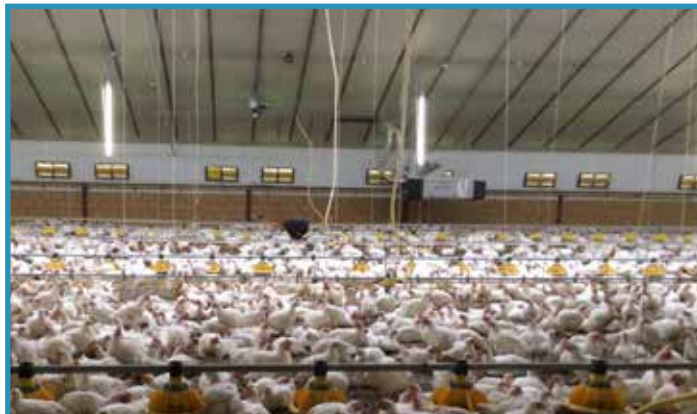
En natuurlijk waren er ontzettend veel kippen!