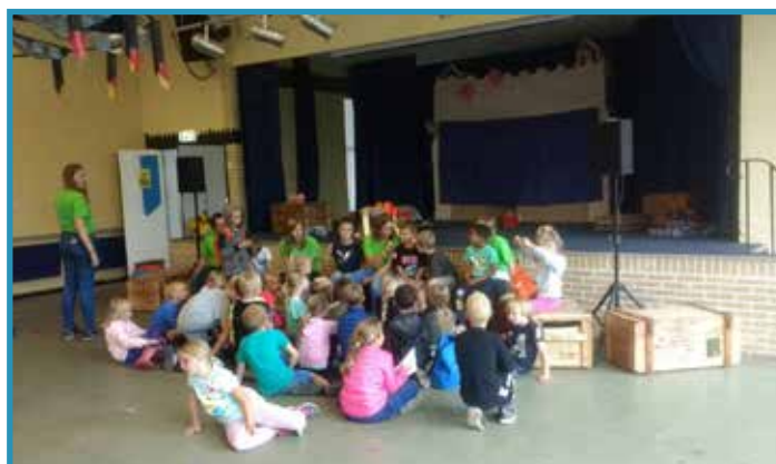
Buiten regen? Dan spelletjes in de grote zaal!