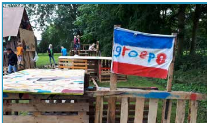
Er zijn veel hutten gebouwd. Deze is van groep 8.