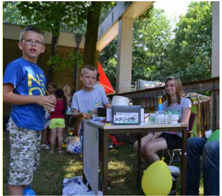
99 luchtballons! Of misschien net ietsje minder... Maar wel leuk!