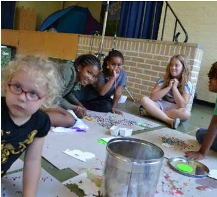
Strijkkralen blijft een leuke bezigheid!