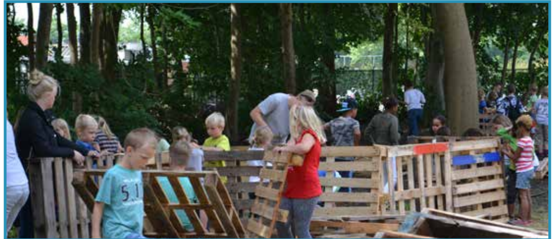
Zoals ieder jaar is het huttenbouwen weer een groot succes!

KRIEBELDAM - Gisterochtend konden de kinderen van de jongste groepen nog even lekker uitslapen terwijl de oudste kinderen al weer op de fiets zaten naar Elders. Dat beviel prima want ze hadden er heerlijk weer bij. De jongste groepen kwamen pas later en gingen lekker op het veld spelen tegenover het ASWA-gebouw. Rond kwart over vijf kwam De Vesting met de patat. Hier hebben we heerlijk van gesmikkeld met elkaar. Na een knakworstje of twee, of drie... en een toetje wilden we eigenlijk naar de Stammenhof gaan. Maar toen werd het ineens heel donker buiten. Dus zijn we lekker binnen muziekbingo