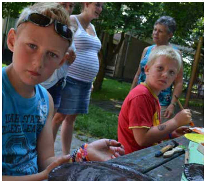
Lekker knutselen en even verschrikt opkijken voor de foto!