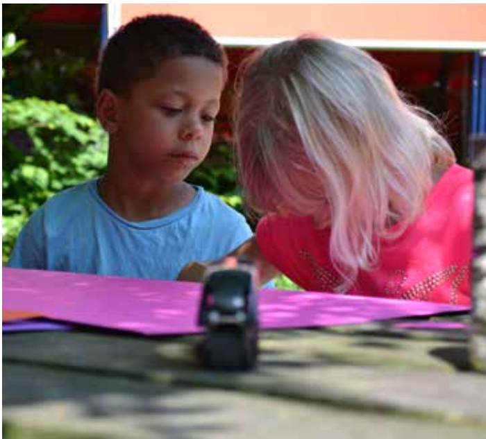
Opperste concentratie en samenwerking!