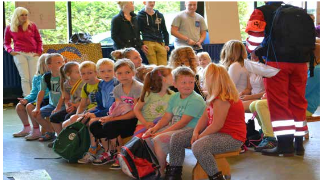
Wij zijn er klaar voor, laat de speurtocht maar beginnen!

Daarom het verzoek om kinderen dan ook niet eerder dan deze tijd te komen brengen. Indien kinderen toch voor deze tijd aanwezig zijn is dit geheel op eigen risico van de ouders!