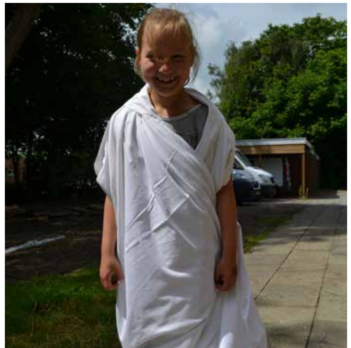
Waar witte lakens al niet goed voor zijn.

10. Kriebeldam is de hele dag bereikbaar op telefoonnummer 0596-623315 (van 08.30 tot 17.00 uur).