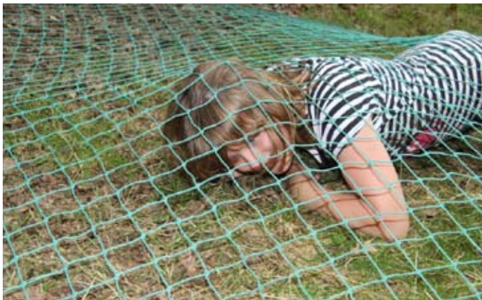
En ja hoor, we hebben er weer eentje gevangen!