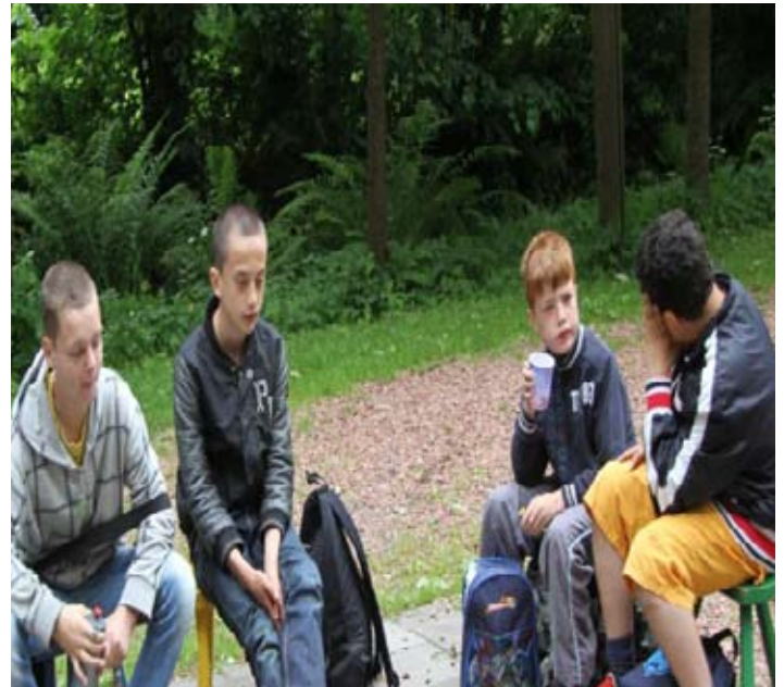
Moe jongens, van het kleine stukje fietsen naar Elders?