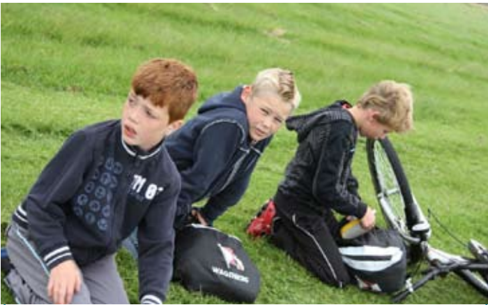
Tijd voor een boterham...