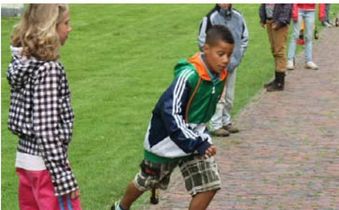
Voetballen voor de Freylemaborg...