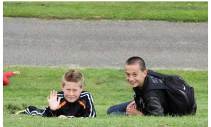
Even wuiven misschien?