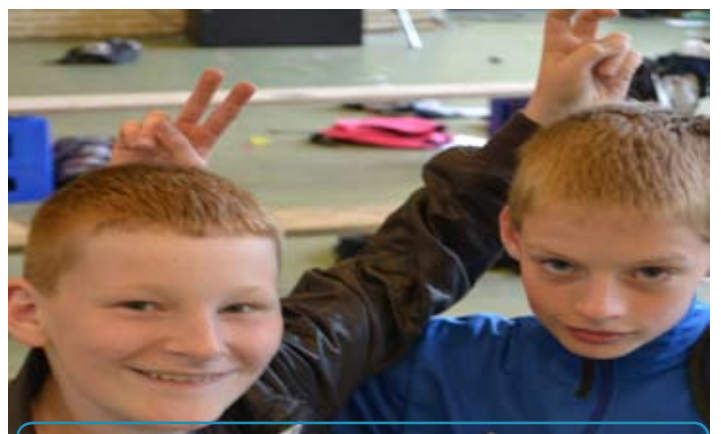
Zoals beloofd, in de Kriebeldammer!