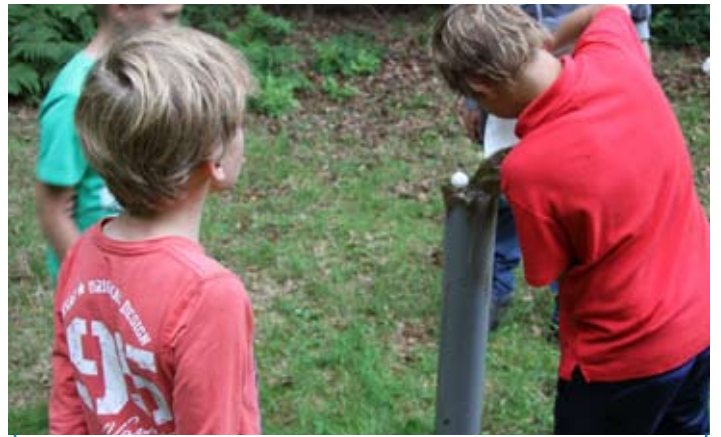
Buis vullen met water...