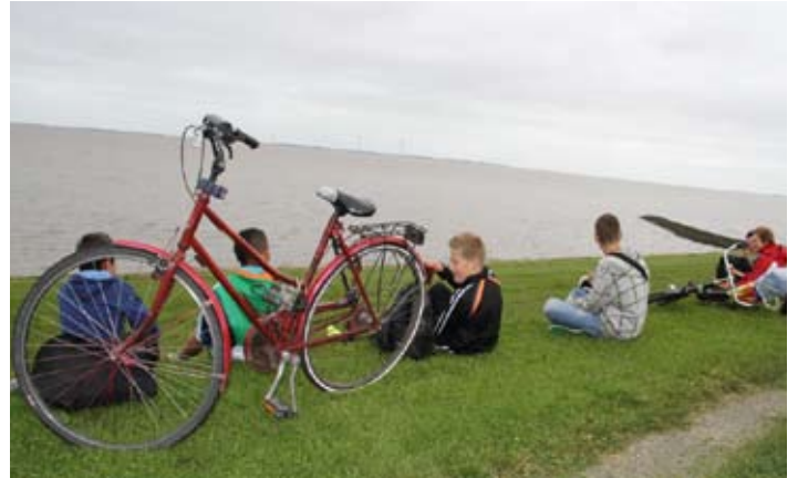
Tussenstop bij op de dijk van Delfzijl, lekker uitrusten aan zee.