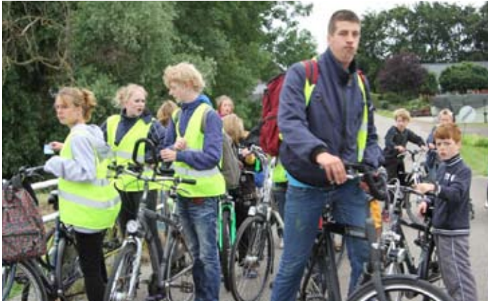
Op de fiets naar Elders!