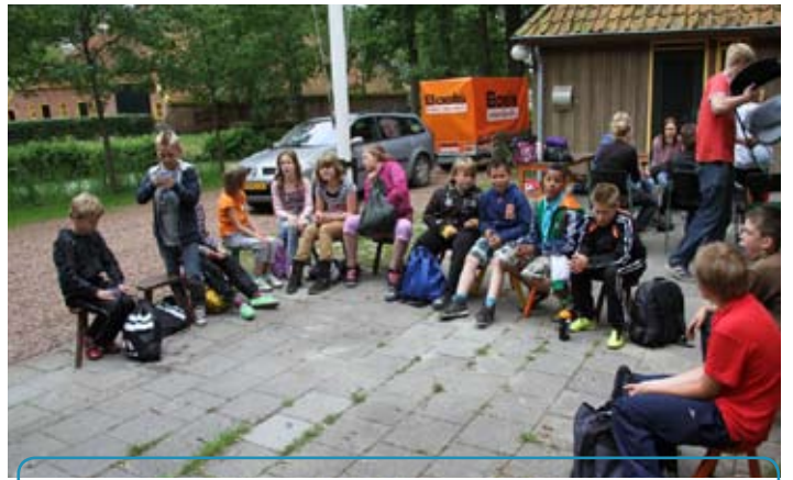
Even rustig zitten na aankomst op Elders