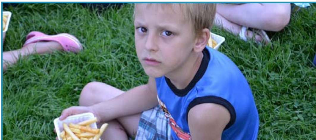
Een lekker bakje patat van De Vesting gaat er altijd wel in...

Aan het einde van de avond begon het echter wat te betrekken. In de verte zagen wij vanuit de grote zaal al wat flitsen in de lucht. Gelukkig sliepen de kinderen al lang toen dat begon maar we kwamen er achter