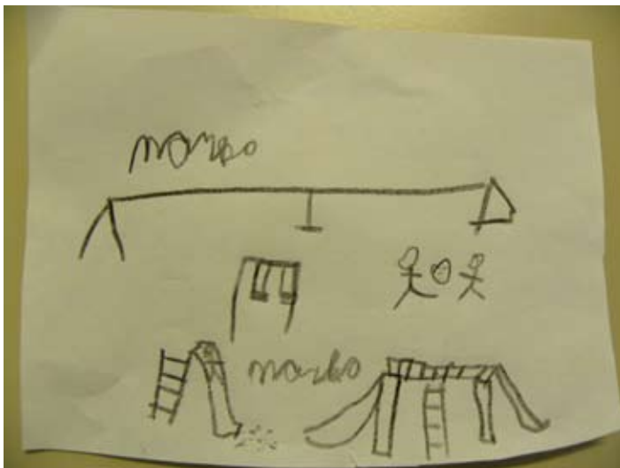
Marko uit groep 6