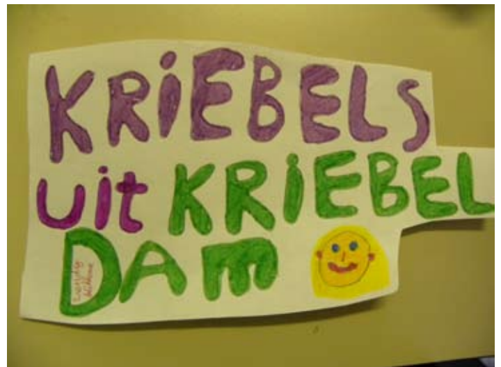
Wendy Flikkema uit groep 7 (ofzo)