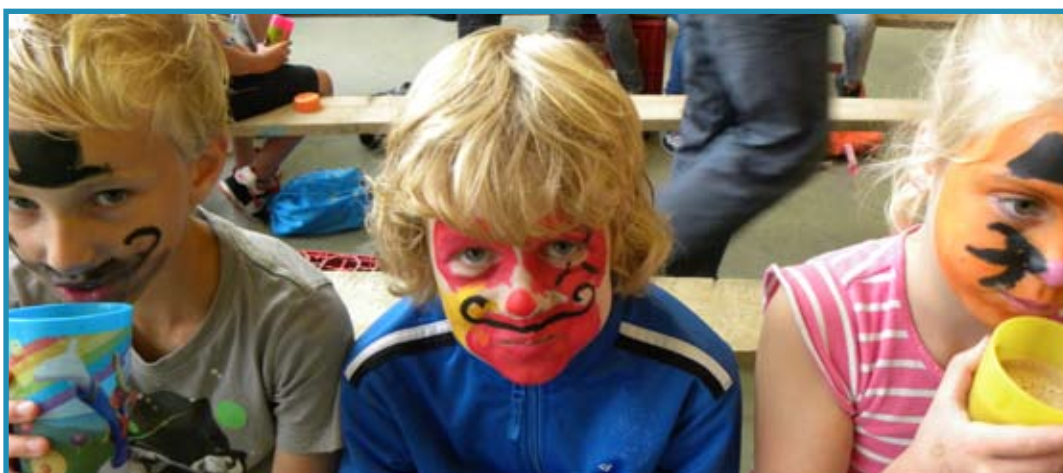
Vrolijke gezichtjes aan de melk en chocomelk tussen de middag!

Rond de middag verzamelden de kinderen van de oudste groepen zich weer op het Kriebeldamterrein om vervolgens op de fiets richting Meedhuizen te gaan waar ze een rondleiding kregen bij Zuivelboer-