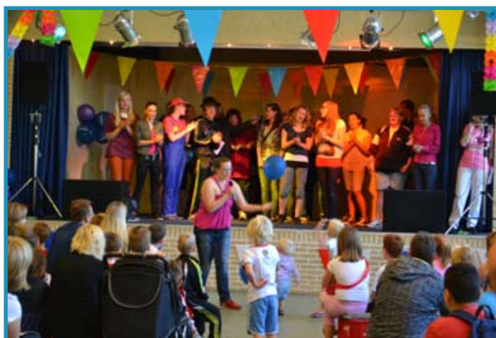
De leiding staat te spingen, ze wachten al zo'n tijd!

KRIEBELDAM - En eindelijk was het dan vanmorgen 23 juli 2012. Heel lang heb ik er op gewacht en vandaag was het weer zo ver! Kriebeldam is weer van start gegaan! En we hebben ook eindelijk eens geluk, want het is droog, warm, het zonnetje schijnt, kortom alle ingrediënten voor een goed begin. En... een goed begin is het halve werk toch? Vanochtend zat de hele zaal weer bomvol enthousiaste kinderen (en leiding) die stonden te popelen om aan de slag te gaan. Inmiddels is iedereen die vaker bij ons komt wel gewend dat we op maandag altijd een speur-